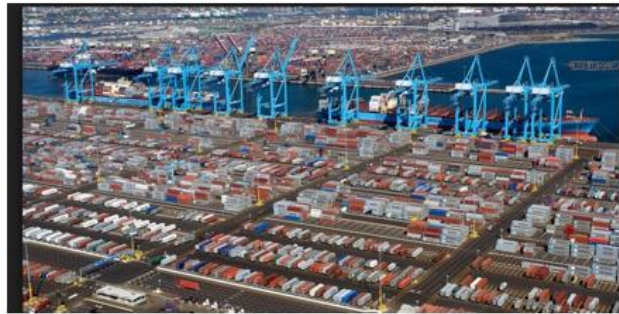
Port de Los Angeles