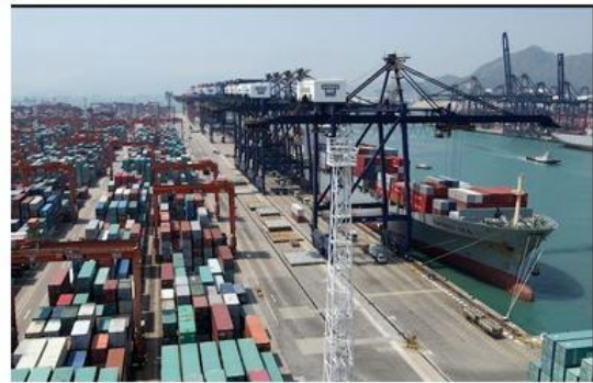
Port de Hong -Kong