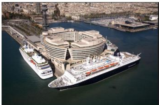
Littoral de Barcelone