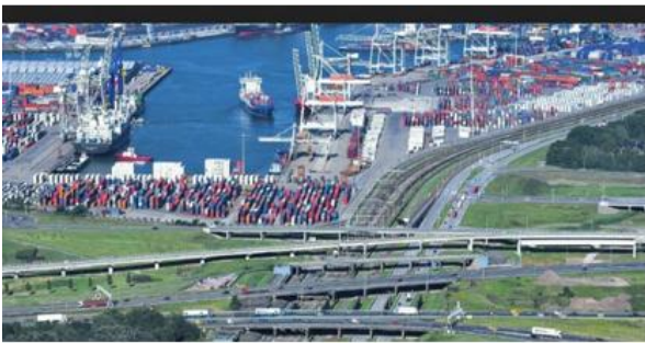
Port de Rotterdam