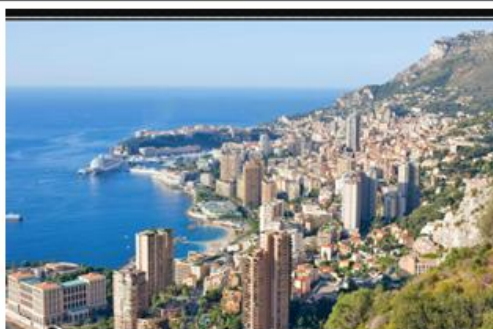
Littoral de Monaco