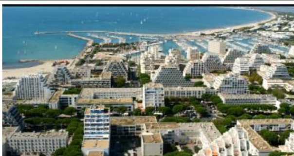
Littoral de la grande motte