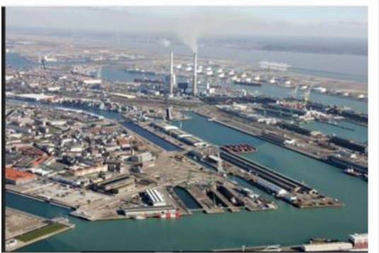
Port du Havre