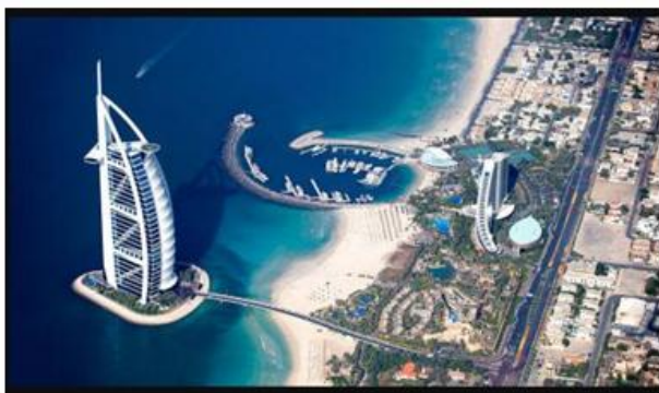
Littoral de Dubaï